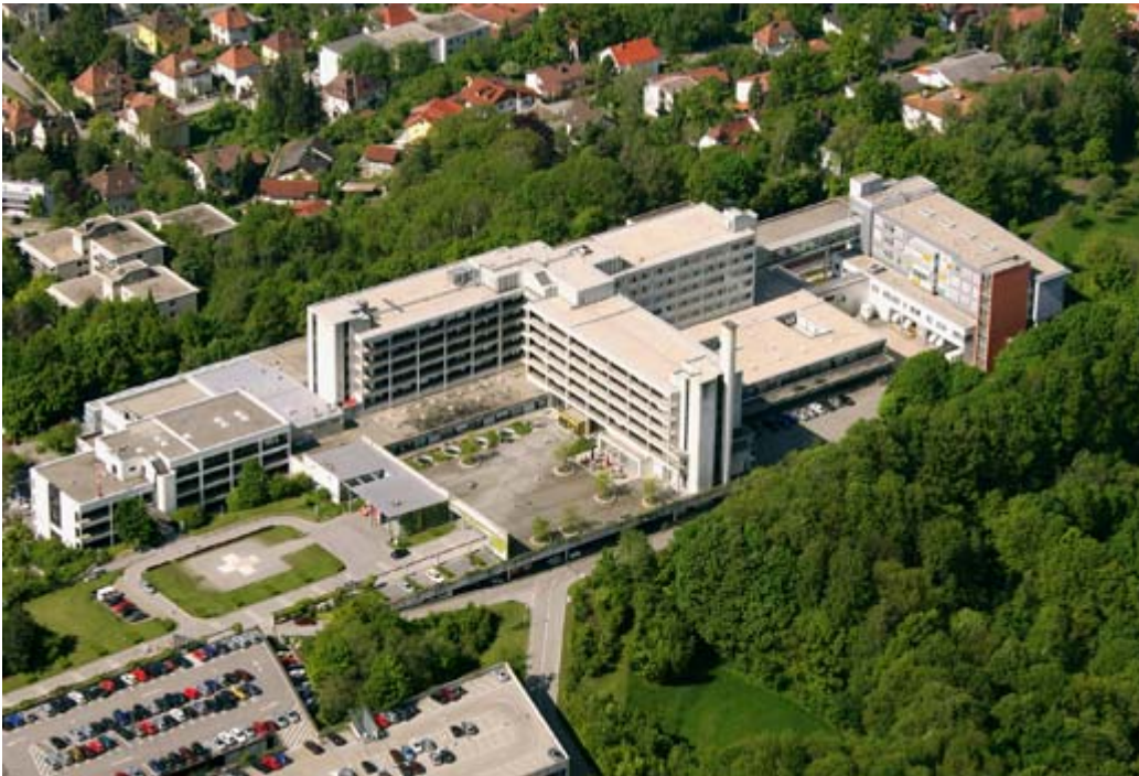
Abbildung: Luftaufnahme Klinikum